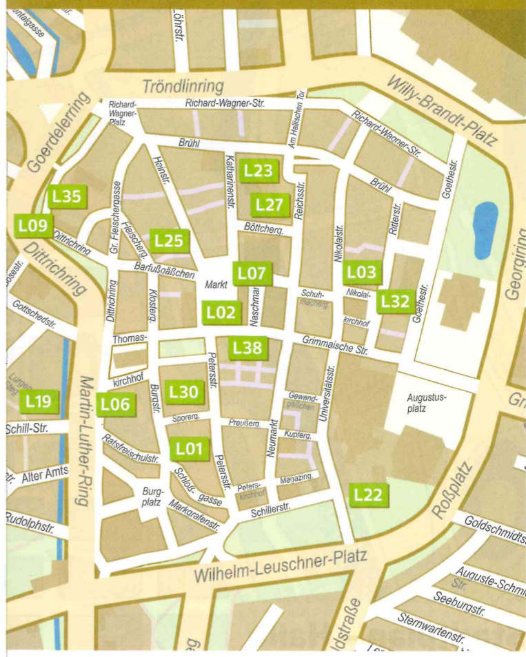
Innenstadtplan - Leipzig